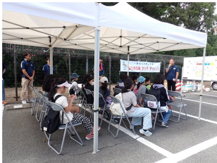
IWFの小澤氏よりスケジュールの案内がされた後、各班に分かれて行動となる