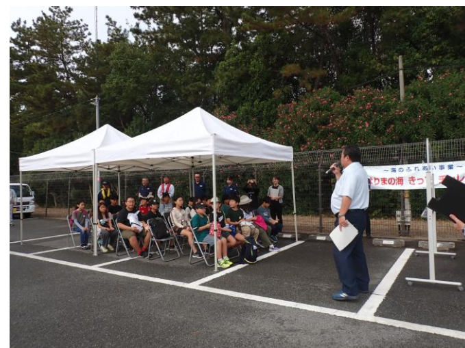
佐伯町長による挨拶。参加者に思い切り楽しみもう！という言葉に子どもたちの目が輝く