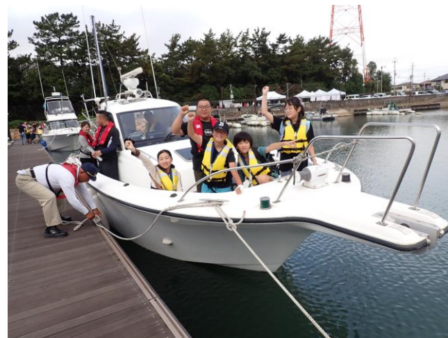
みどりⅣの船首が毎回大人気