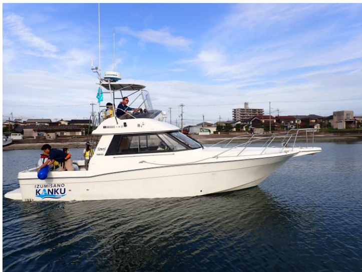
HERMONY1の上いきたい！！下の階の操船席に座りたい子も多かった