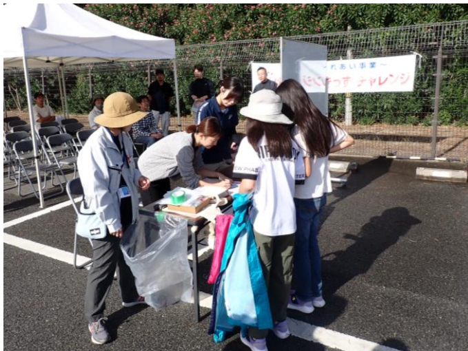
参加者対応 受付順次開始