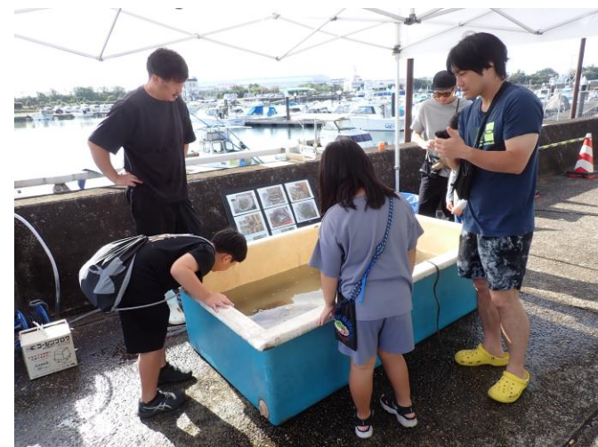
播磨町漁協による水槽には、タコやエイ・フカ（サメ）など