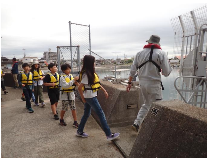
海辺のアクティビティには救命胴衣は必須。海の安全面も含め体験