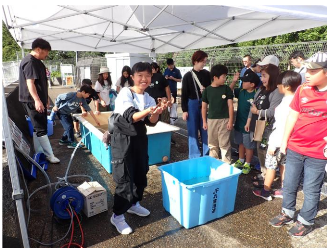
開会式前のタッチプールは、大人気。生き物の感触を楽しみ笑顔があふれた